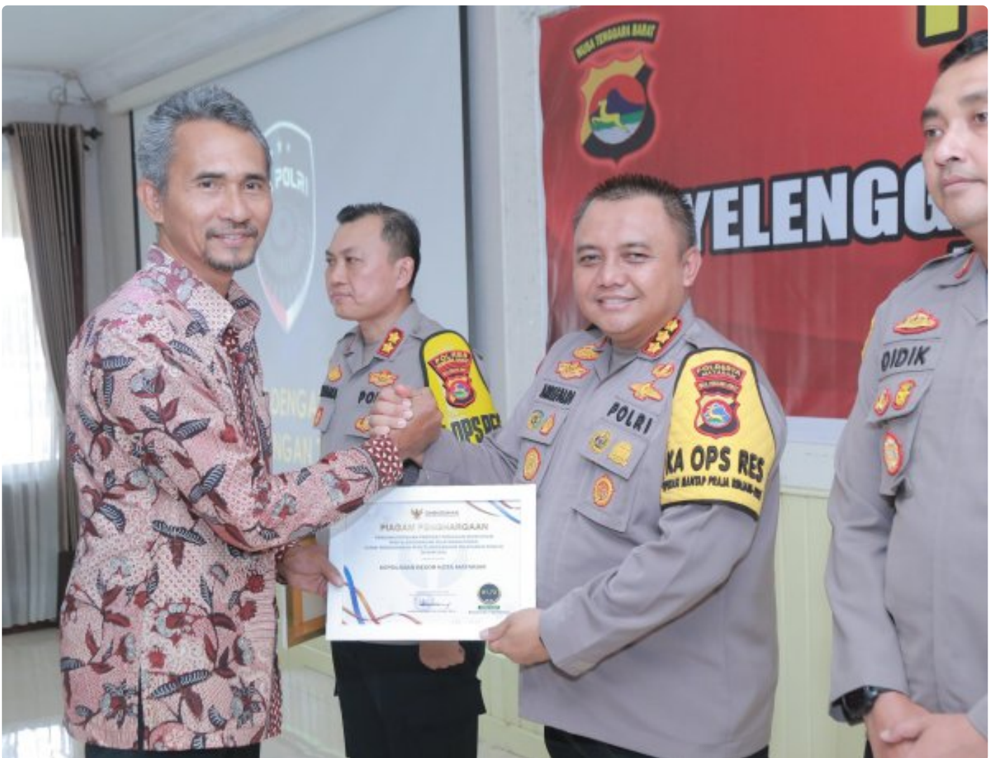
Kapolresta Mataram saat menerima Penghargaan dari Ombudsman RI perwakilan NTB, Kamis (19/12/2024)

MATARAM, NTB – Polresta Mataram kembali mengukir prestasi dengan meraih Predikat Kepatuhan Penyelenggaraan Pelayanan Publik Tahun 2024 dari Ombudsman NTB. Polresta Mataram menjadi salah satu dari delapan Polres/ta